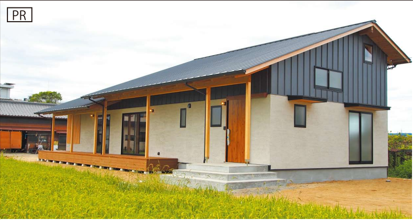
▲田んぼや遠くの山が借景となり、自然と見事に調和する住まい

会場では、杉でできた床板にも注目を。合板フローリングにはない柔らかさと歩き心地は、一度歩くと忘れられない体験になるかもしれません。見学会は予約制につき、事前にお電話を。